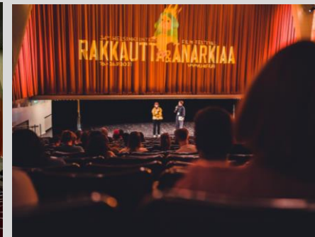
Bio Rex / sali / salen / hall